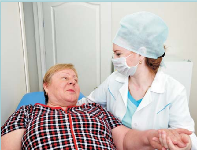
«Голубая шапочка беленький халат. У акушерки нашей добрый взгляд»