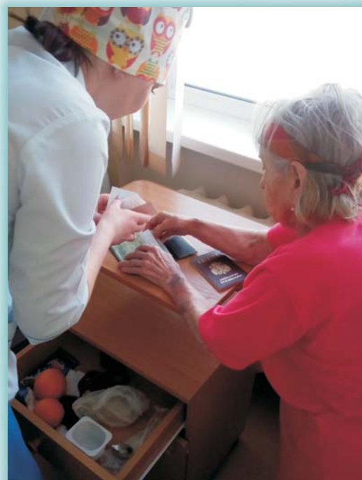
«Я всегда рядом!»